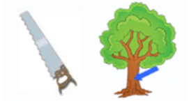
Scie tronc (citron)