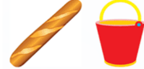
Pain sceau (pinceau)