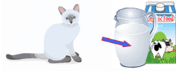
Chat lait (chalet)