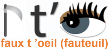
faux t'oeil (fauteuil)