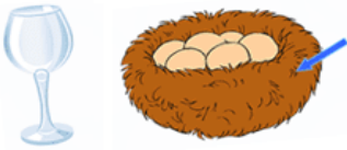
Verre nid (vernis)