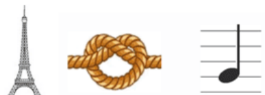
Tour noeux sol (tournesol)