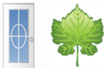
Porte feuille (portefeuille)