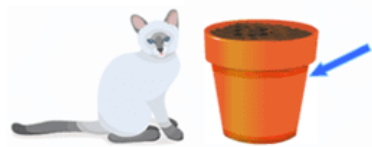
Chat pot (chapeau)