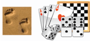
Pas jeux (page)