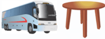
Car table (cartable)